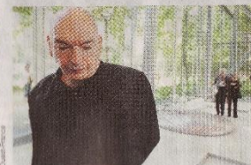
L'architecte Jean Nouvel devant une « expansion », lors du vernissage, dimanche dernier.

série encore jamais montrée à Paris : « La suite milanaise ». Sa dernière : « neuf Fiat neuves pressées comme des draps et peintes à la main comme des Astor Martin ».