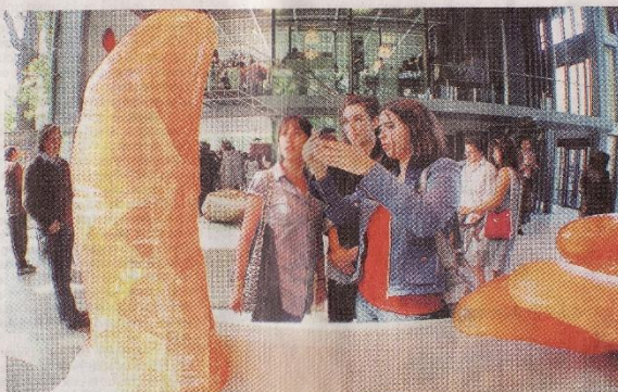
Devant l'un des célèbres pouces de César, en résine.

Au rez-de-chaussée, le lauréat du prix Pritzker, le nobél de l'architecture, a choisi de montrer, d'un côté les « empreintes humaines » du sculpteur (pouces, poing, sein, encre, etc.) et de l'autre (des toutes tailles) de faire ses « expansions », mou-