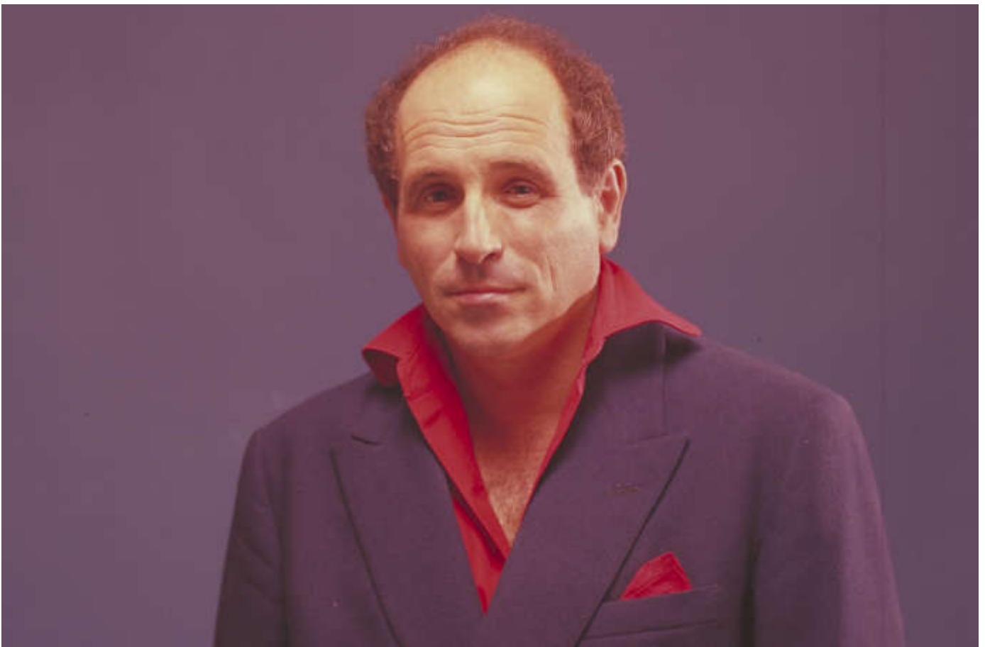
Léo Ferré lors de la séance photo de « Paname », en 1960. ANDRÉ GORNET

Par Sylvain Siclier - Publié le 19 septembre 2020 à 08h00