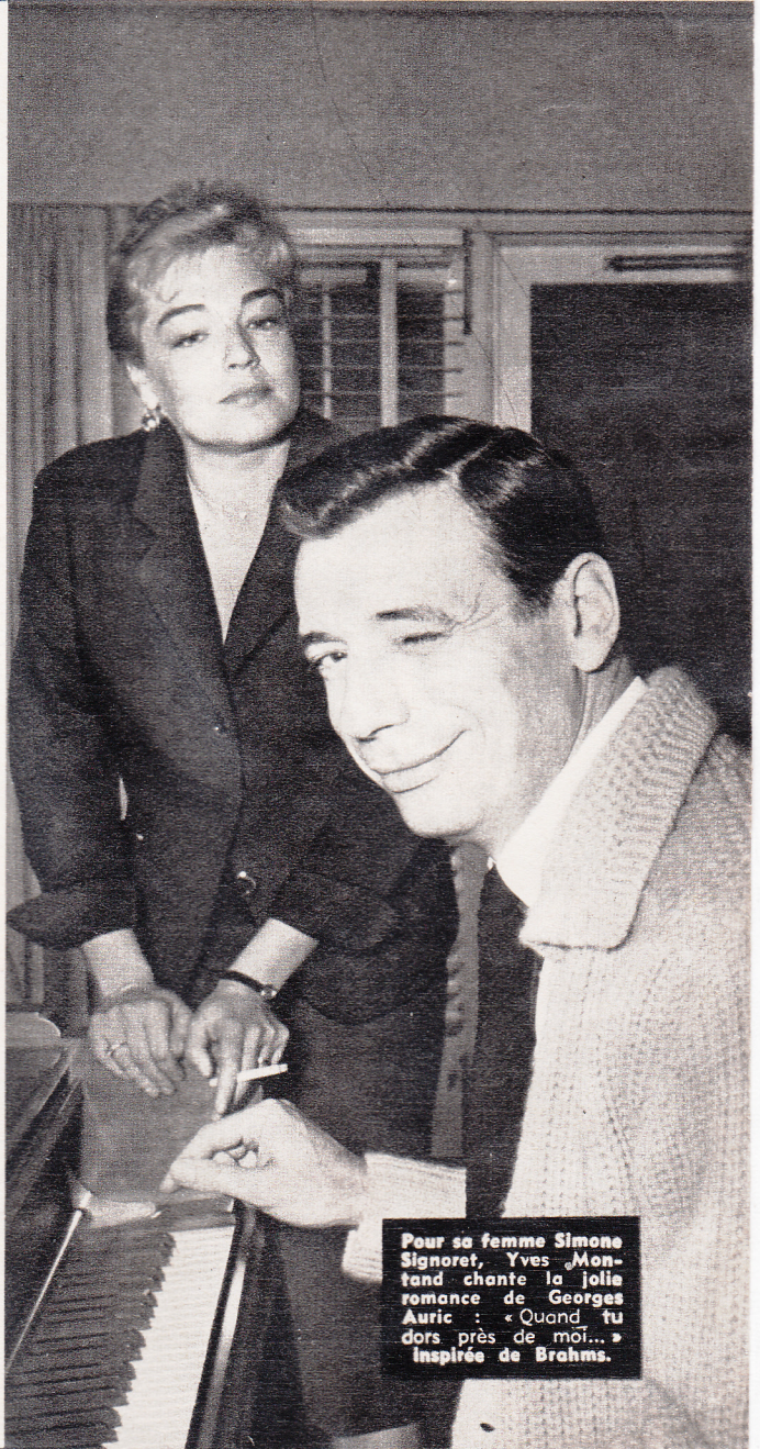
Pour sa femme Simone Signoret, Yves Montand chante la jolie romance de Georges Auric : « Quand tu dors près de moi... » inspirée de Brahms.