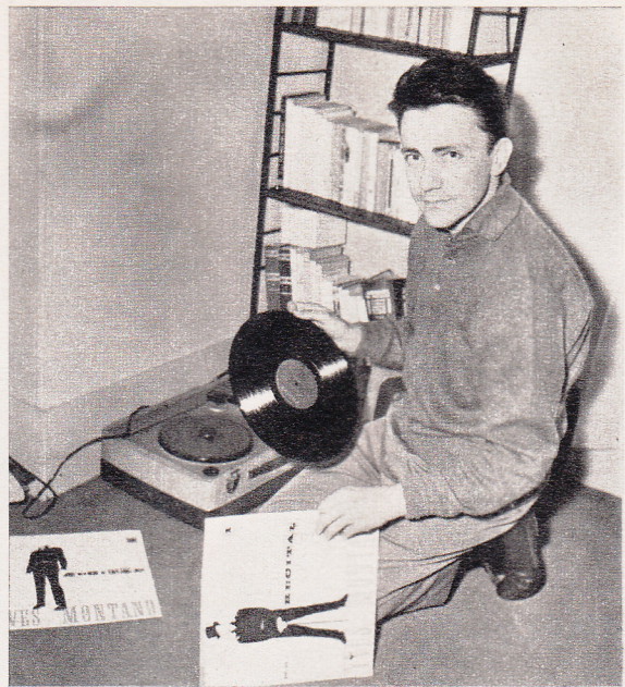
Serge Rousseau — qui a joué dans Les Mauvais Coups avec Simone Signoret — aime les disques d'Yves Montand.