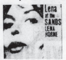
Lena Horne en personne

LENA HORNE: "Lena At The Sands" (RCA Victor, mono: LPM-2564, stéréo: LSP-2564); "Maybe"; "The Man I Love"; "Get Rid Of Monday"; "A Ride On A Rainbow"; "Never Never Land"; "I Said No"; "Some People You Don't Have To Know The Language"; "Out Of My Continental Mind"; "A Cock-Eyed Optimist"; "I Have Dreamed"; "Surrey With The Fringe On Top"; "Thrill Me"; "What Is There To Say"; "The Begat"; "Don't Commit The Crime". Direction d'orchestre: Lennie Hayton.