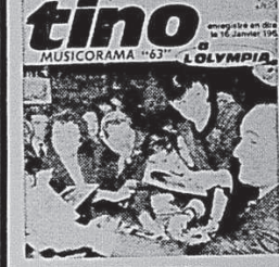
TINO ROSSI "A L'OLYMPIA" Naple au baiser de feu — La paloma — Tchi-Tchi — J'avais vingt ans. Mono 67109