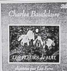
LEO FERRE "Les Fleurs du mal" de Charles BEAUDELAIRE MONO: 67-104