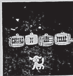
LEO FERRE "ENCORE... DU LEO FERRE" Le temps du tango, l'été s'en fout, mon camarade. MONO: 67-116