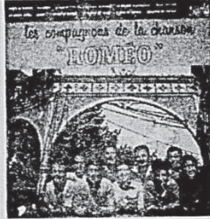
LES COMPAGNONS DE LA CHANSON "Romeo" — Notre Concerto — Le bleu de l'été — La semaine. Mono 67069