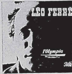
LEO FERRE "RECITAL A L'OLYMPIA" Monsieur mon passé, le piano du pauvre, l'homme, etc. MONO: 67-117