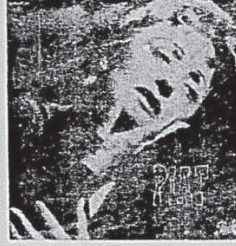
EDITH PIAF "PIAF" Exodus — Marie Trottoir — Qu'il était triste cet Anglais. Mono 67067