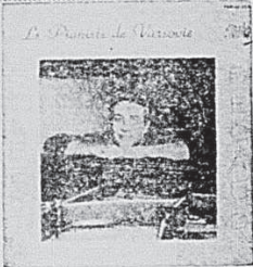
GILBERT BECAUD "Le pianiste de Varsovie" — Et Maintenant — Tête de Bœuf — Etc. Mono-Stéréo 67060