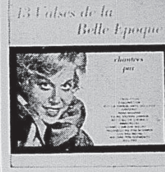
MATHE ALTERY "13 VALSES BELLE EPOQUE" Frou-Frou — Fascination — Rose Mousse — Reviens. Mono 67113