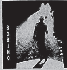
LEO FERRE "RECITAL A BOBINO" La fortune, pauvre Rute-boeuf, Paris canaille, etc. MONO: PAM-67-118