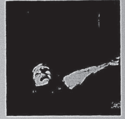
LEO FERRE "LE GRAND FERRE" Le pont Mirabeau, Notre-Dame de la Mouise, vitrine, etc. MONO: 67-119