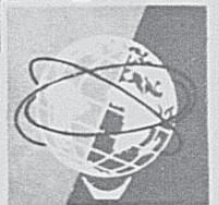
Symbole de l'exposition mondiale de New-York 64-65

Si vous pouvez posséder une automobile, vous pouvez aussi vous offrir une piscine ROY de grande qualité... la piscine choisie pour figurer à LA MAISON DU BON GOÛT, à l'exposition mondiale de New York 64-65. Les piscines ROY sont garanties jusqu'à 10 ans, et l'installation est gratuite au Québec. Vous pouvez en obtenir une à partir d'aussi peu que $1895. Le paiement initial est minime et les versements mensuels très raisonnables. Pour obtenir de plus amples détails sur la variété de piscines ROY, découpez cette page, inscrivez-y vos nom et adresse, et faites-la parvenir à l'adresse indiquée.