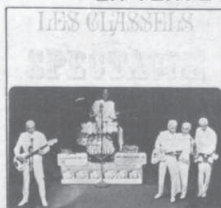
TRANS CANADA TF-336 LES CLASSELS en spectacle