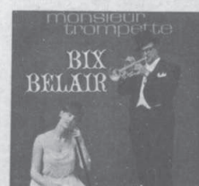
TRANS CANADA TSP-1338 Monsieur Trompette BIX BELAIR