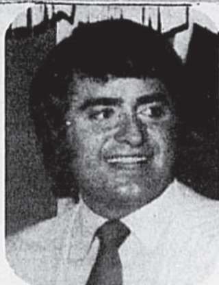
Michel Louvain sera bientôt reçu par le gouvernement grec.