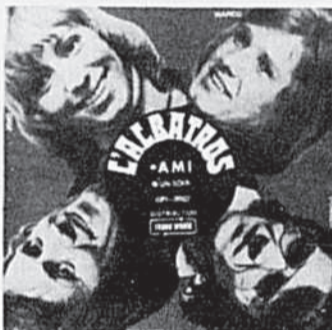
L'Albatros ... une place de choix au palmarès.