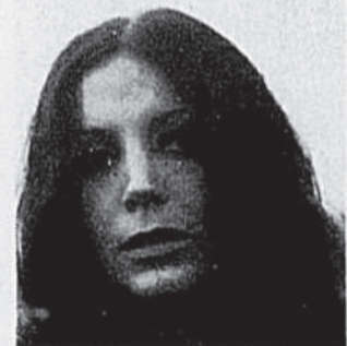
Renée Claude ... un petit chef-d'oeuvre.

JEAN NICHOL, à l'instar de son idole Tom Jones, continue avec succès à se spécialiser dans la reprise de très anciens