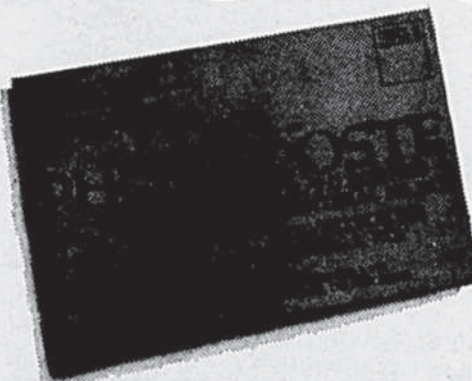
Photo Poste a été une des premières maisons au pays à vous offrir un service complet de finition de photos (photos couleur, photos noir et blanc, diapositives) par la poste.

Seize années d'expérience, l'équipement le plus moderne qui soit, 175 techniciens experts, l'emploi exclusif de solutions chimiques et de papier KODAK, sont votre garantie de qualité, sûreté et rapidité.