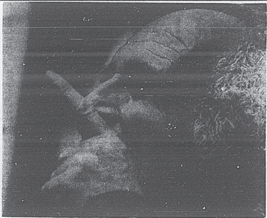
LEO FERRE Si tu t'engages, t'es foutu.

Il avait refusé à son étudiant-interviewer de parler de son évolution musicale.