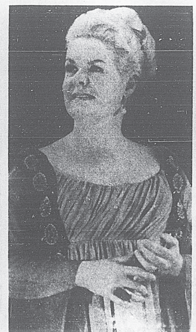
LUNDI SOIR — Le contralto canadienne Maureen Forrester sera la soliste du premier concert de la saison de l'Orchestre de chambre McGill, lundi soir.

ARENA MAURICE-RICHARD — Auj. à 20 h. 30: troupe folklorique Dukla. LE PATRIOTE (1474 Ste-Catherine E.) — Jusqu'au 1er octobre: Pauline Julien. Le samedi à 20 h. et 23 h., les dimanche, mardi, mercredi, jeudi et