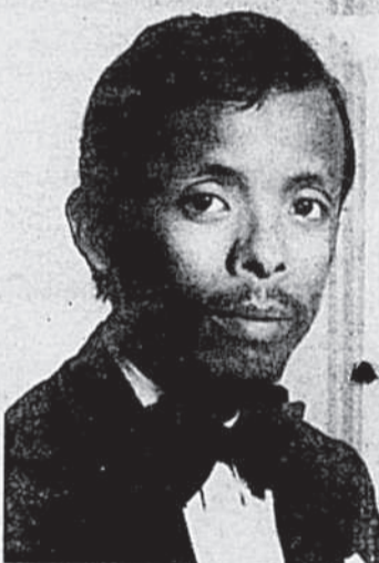
Rocky: meilleurs vœux de bonheur.