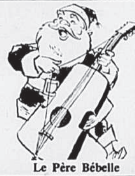
Le Père Bébelles

spectacle du Théâtre Objectif du Québec — Salle Vincent-Piette, 1370 est, boulevard Saint-Joseph — Entrée libre.