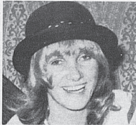
Diane Dufresne... il fallait s'y attendre.

DIANE DUFRESNE a remporté un tel succès sur le marché du disque européen avec "J'ai rencontré l'homme de ma vie" que Raymond Lefebvre a décidé d'en faire une version instrumentale et de l'utiliser comme pièce-titre du dernier microsillon enregistré par le célèbre orchestre qu'il dirige. Cet album Riviera 70037 se vend $6.29 et, pour prouver l'importance du succès remporté par cette chanson de François Cousineau, il n'y a qu'à la comparer avec les autres titres de ce 33 tours, dont le plus connu est tout de même le dernier grand prix Eurovision de la chanson, "Tu te reconnaitras".