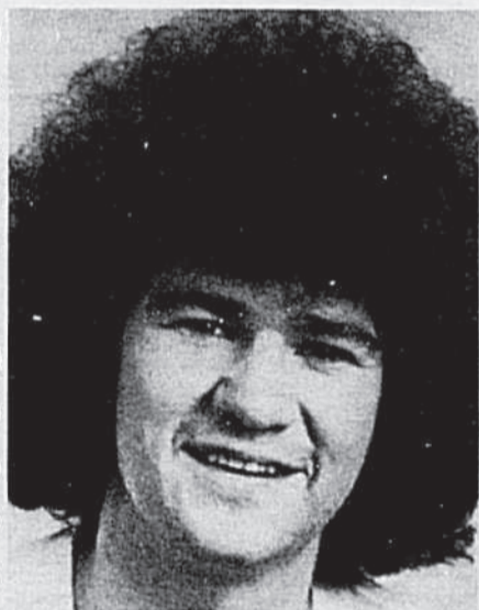
Robert Charlebois... tout un programme

Parmi les autres nouveautés il y a, sur le plan local, le nouveau microsillon de ROBERT CHARLEBOIS, qu'il a intitulé "la Solidarité". Nous ne l'avons pas encore reçu, donc pas écouté, mais, d'après les titres, il semble aussi original que les précédents. Jugez-en: "Cauchemar", "le Révolté", "Entr' deux joints", "Witchi Tai To", "Cajun Stripper", "Alchimie", "Insomnie", "Adieu Alouette", "Vivre en ce pays", "Avril sur mars", "le Piano noir". C'est tout un programme, vous en conviendrez. C'est un disque Barclay 80173 qui se vend seulement $6.29.