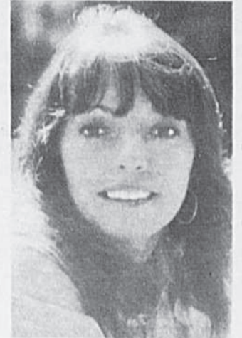
Emmanuelle... une oeuvre de grande classe

René Angelil, mari et producteur d'Anne Renée, n'a rien négligé pour offrir à sa jeune et jolie épouse un autre hit à son palmarès et, puisqu'il faut parfois faire des prédictions, nous pensons que "Quand j'étais un enfant" sera le plus grand succès de la jeune carrière d'Anne Renée.