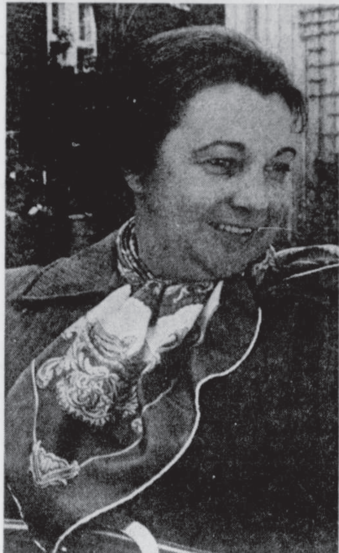
Lise Payette... "Appelez-moi Lise"

On dira ce que l'on voudra, mais l'automne, devant le téléviseur, se présente à nouveau avec une petite bataille de prestige entre le réseau français de Radio-Canada et celui de TVA-Télé-Métropole. Mais, la rivalité, si elle existe toujours et tous les jours, n'importe quelle heure entre les postes qui diffusent les émissions de l'une ou de l'autre des deux grandes maisons-mères de Montréal, semble surtout se cristalliser, au niveau de la publicité du moins, à la fin de la soirée, à 23h00. Au moment de la journée où certains téléspectateurs décident d'aller dormir pendant que d'autres jouent au jeu d'aller voir à un poste puis à l'autre, quels seront les invités des "placoteux".