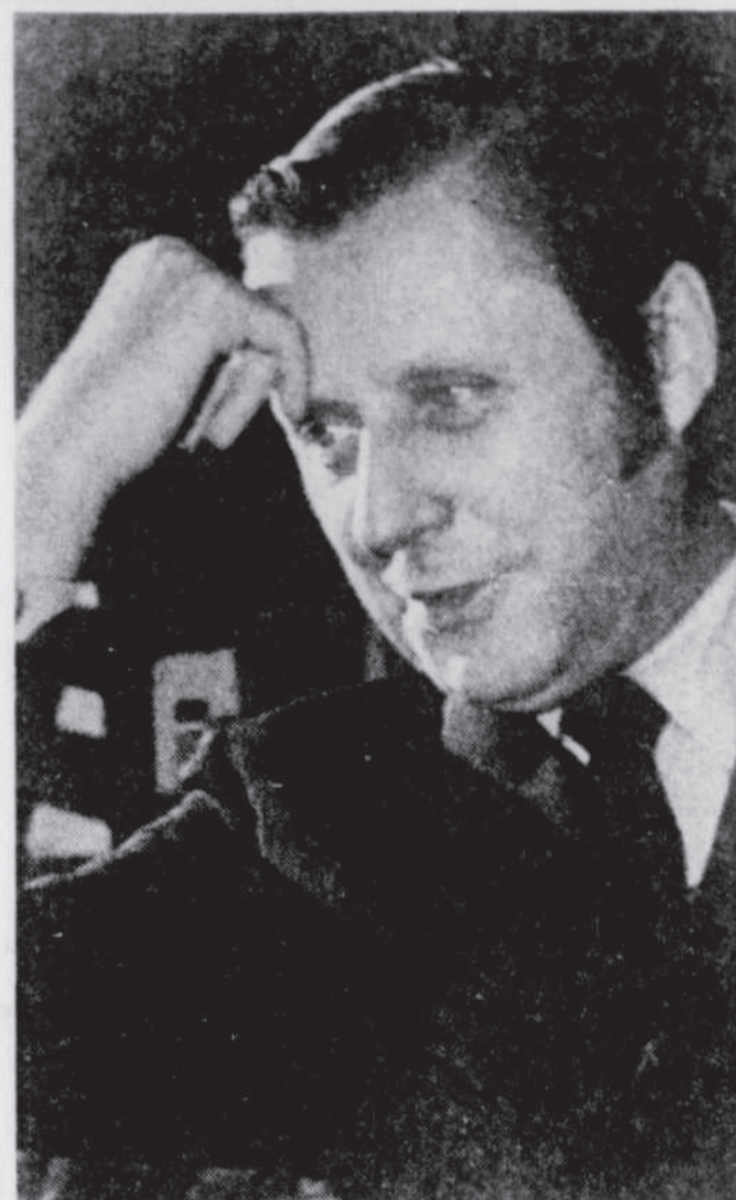
Jacques Normand: "La Normandise"

Aznavour se prête au jeu parce que depuis le temps qu'il vient ici, il connaît tout le monde et est parfois prêt à faire plaisir à ses amis sur place. Mais, c'est plutôt au niveau des radios que l'on rejoint, hors de Montréal, les vedettes internationales de la chanson francophone. Et là, Dieu merci, personne n'a encore eu la prétention d'avoir des exigences d'exclusivité.