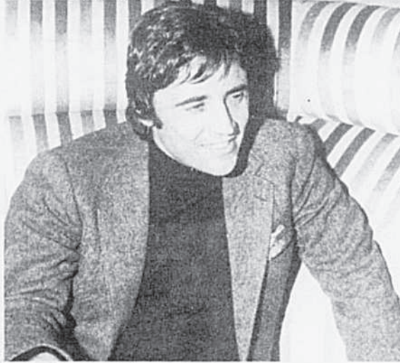
Sacha Distel: le Pierre Lalonde des Français.

Terminons par l'O.S.M. et ses concerts-galas. Rafael Frühbeck de Burgos sera au pupitre les 19 et 20 mars à la salle Wilfrid-Pelletier. Vous pourrez entendre "la Création" de Haydn avec Edith Mathis, soprano, Robert Tear, ténor, et Hans Sotin, basse.