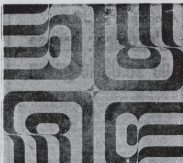
"Aelcano" de l'Espagnol Manuel Barbado est l'un des graphiques produits à l'aide de l'ordinateur. Cette collection est en montre au pavillon Pollack de l'université Laval.