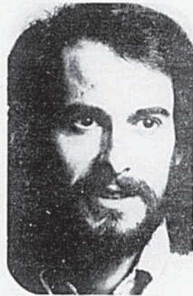
Michel Fugain: il est attendu

Si vous assistez à son show, j'espère que vous ne serez pas déçus. Il viendra au Québec, grâce à Kébec Spec, avec la collaboration de CJMS, CJRP et CJRS.