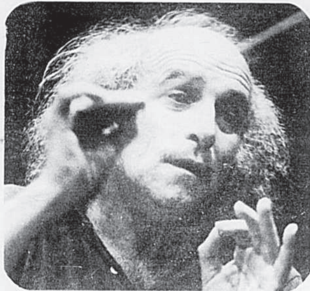
Léo Ferré: c'est un cas!