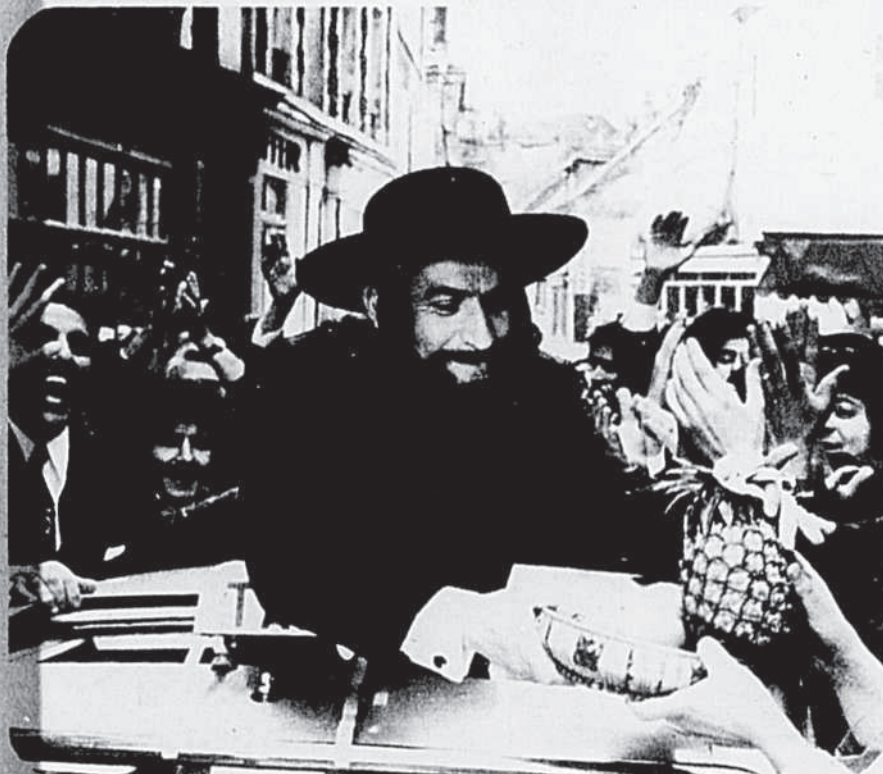
Louis de Funès... un comique que j'aime bien.

Il est très difficile de me faire sortir, je préfère demeurer chez moi, écouter quelques disques dans une atmosphère qui me plaît... plutôt que d'assister à un concert. La musique classique est sans doute celle que je préfère; surtout Bach et Beethoven. Du côté des chansonniers, il