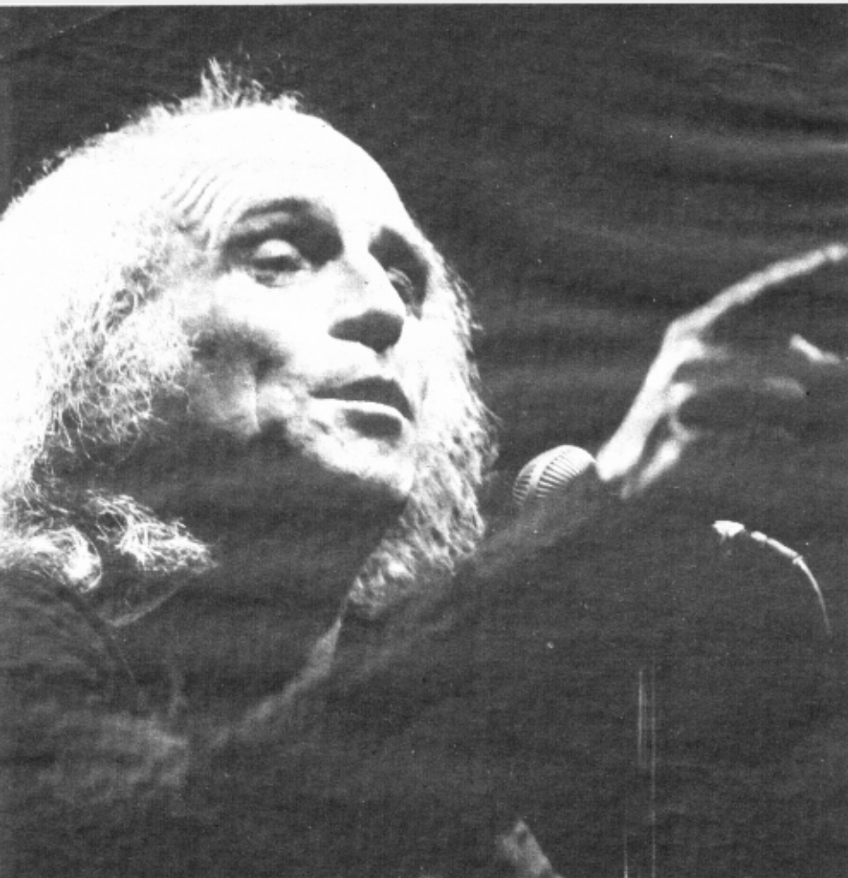
La poésie est une clameur. Elle doit être entendue comme la musique.