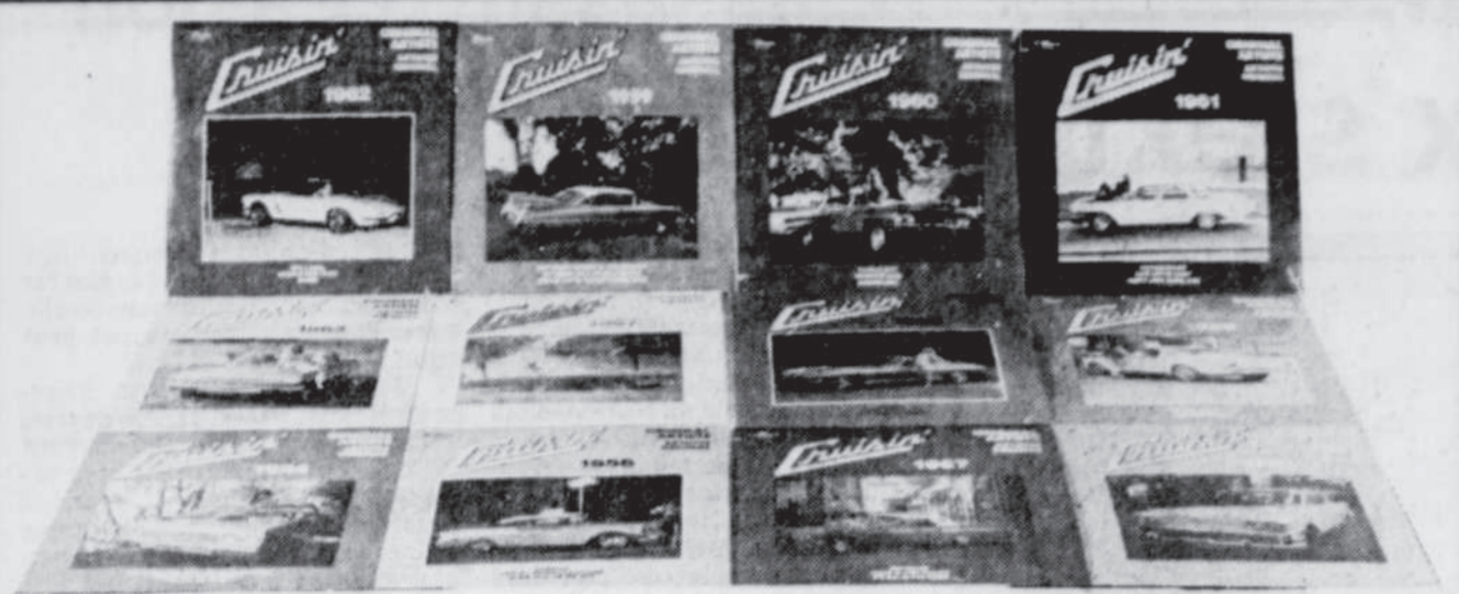
Les pochettes de la collection "Cruisin" montrent une série de voitures d'époques sur lesquelles sont étendues de jolies filles. Je trouve ce procédé inadmissible: des plans pour égratigner ces merveilleuses voitures...