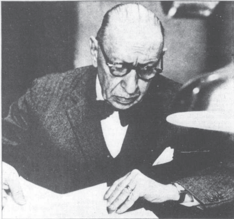
Igor Stravinsky (1882-1971):