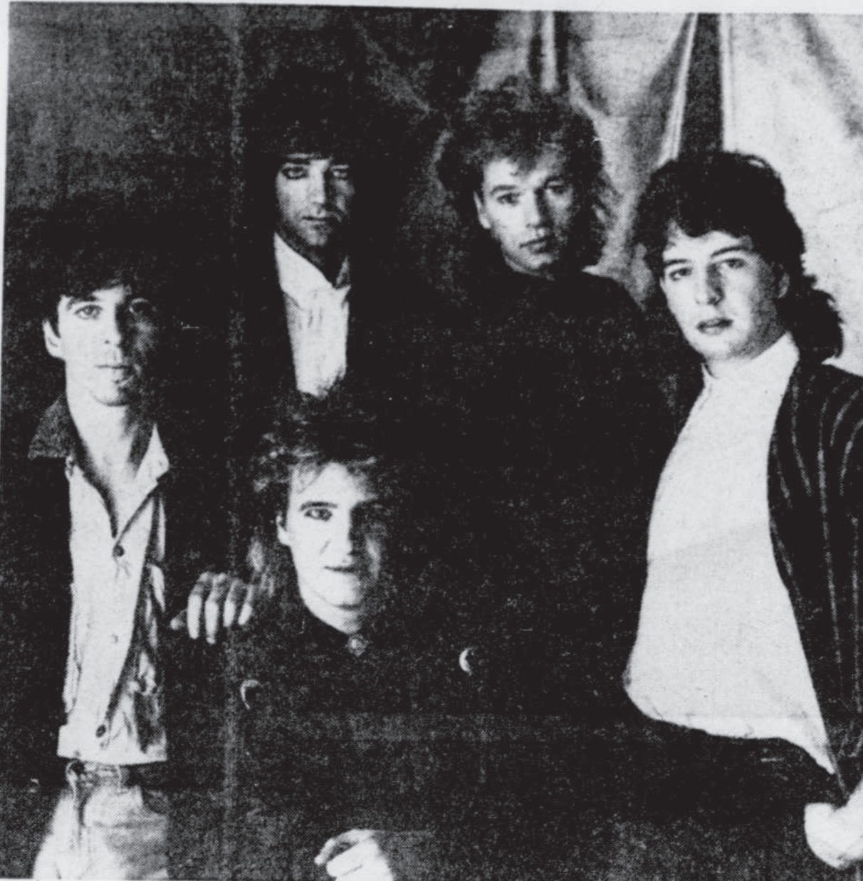
Au groupe vedette Chicago s'ajouteront Autograph, Glass Tiger (ci-dessus) et Tom Cochrane.

Aucune pièce jouée par l'ensemble des artistes n'est prévue, mais on sait que David Foster, qui a écrit la chanson thème de RV87, a aussi été le réalisateur des derniers disques du groupe Chicago, ce qui laisse entrevoir une fin un peu particulière.