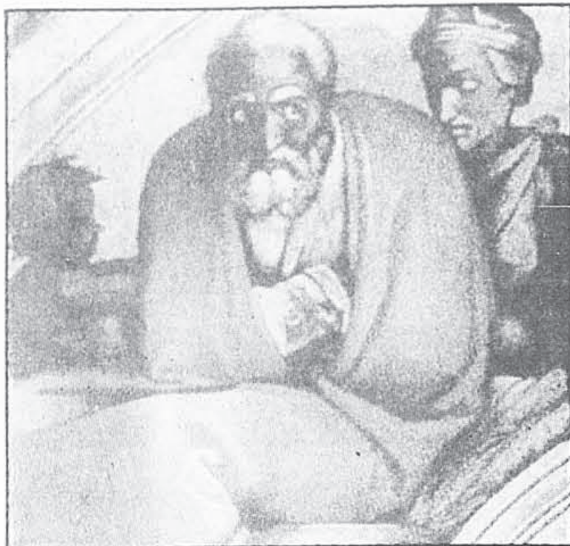
Détail de l'une des fresques de Michel-Ange dans la Chapelle Sixtine.