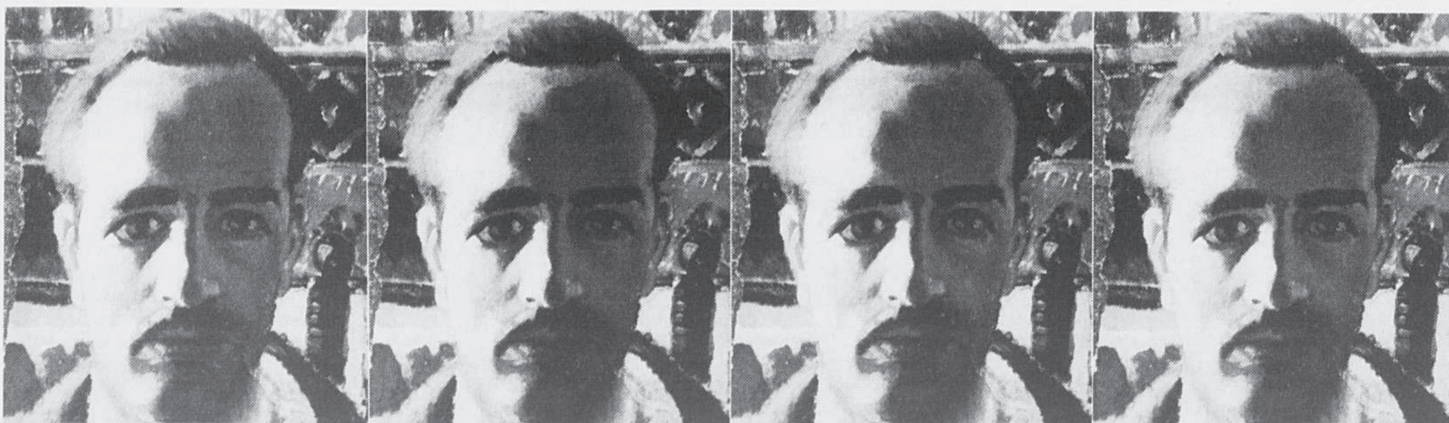
Autoportrait, 1928. Musée des beaux-arts du Canada, Ottawa

Le Musée remercie de leur appui le Programme d'appui aux musées de Communications Canada, le ministère des Affaires indiennes et du Nord canadien, le Conseil des arts du Canada, le ministère des Affaires culturelles du Québec, le Gouvernement des Territoires du Nord-Ouest, Bath Belle Robb Ltee