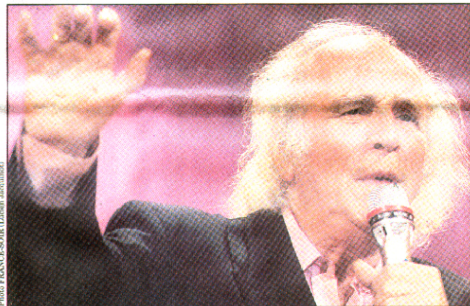
L'« ANAR », lors d'un de ses derniers récitals avant sa retraite en Toscane.