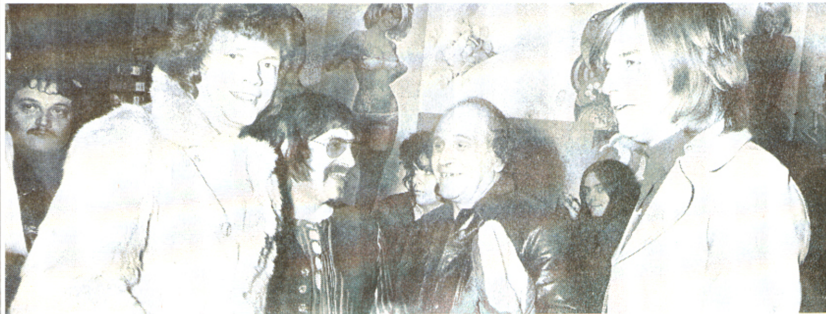
1970 à Paris, Léo Ferré est ici entouré des Moody Blues qu'il avait glissés dans le refrain de l'une de ses chansons.

Le corps de Léo Ferré doit être transporté ce samedi à Monaco pour les obsèques prévues dans la principauté. RTL lui rendra hommage lundi 19 juillet en rediffusant à 13 h 30 l'émission « Grand Format » qu'Evelynne Pages lui avait consacrée. De 20 h à 21 h 00, RTL retransmettra le récital qu'il avait donné pour la station le 22 mars 1990.