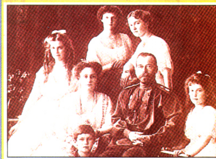
LES RESTES des Romanov viennent d'être formellement identifiés