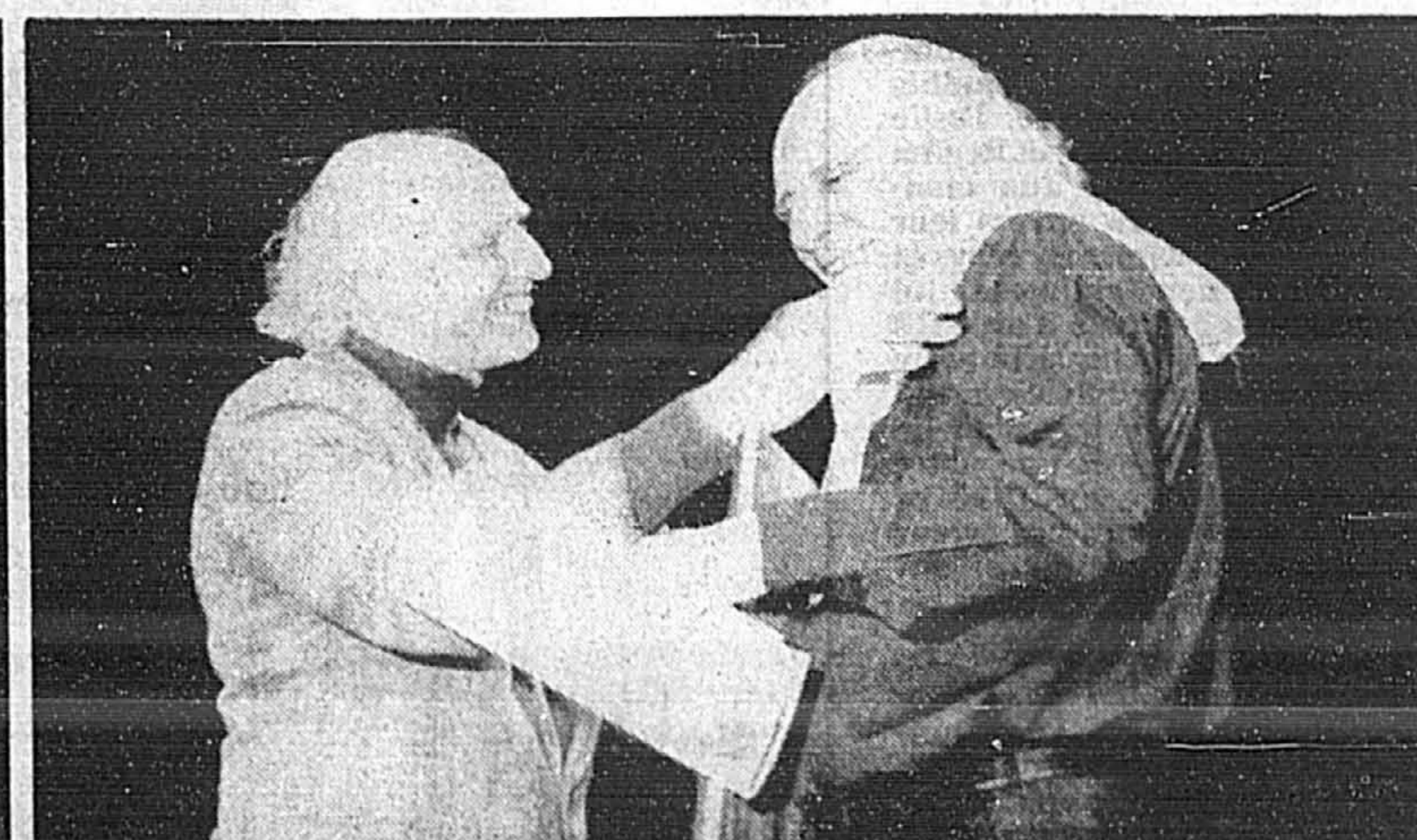
Gilles Vigneault accueillait Léo Ferré à Québec le 26 septembre 1990, à l'occasion d'un hommage qu'a voulu rendre au poète-chansonnier français l'organisation du Festival d'été de Québec.