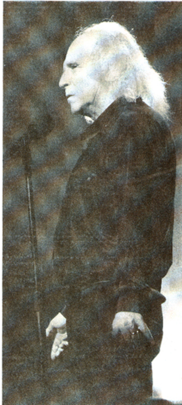
En concert, toujours vêtu de noir.