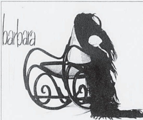
Ma plus belle histoire d'Amour... c'est Vous

Le dernier disque du coffret est un peu le bijou des collectionneurs puisqu'il reprend l'émission radiophonique d'Europe 1, Cahier de chanson . Une perle rare qui regroupe 40 minutes de musique inédite durant lesquelles Barbara interprète des classiques de Piaf ( Un monsieur me suit dans la rue ), de Gainsbourg, Ferré, Trenet et Aznavour. Un petit cadeau qui, à lui seul, justifie, l'attrait porté au coffret.