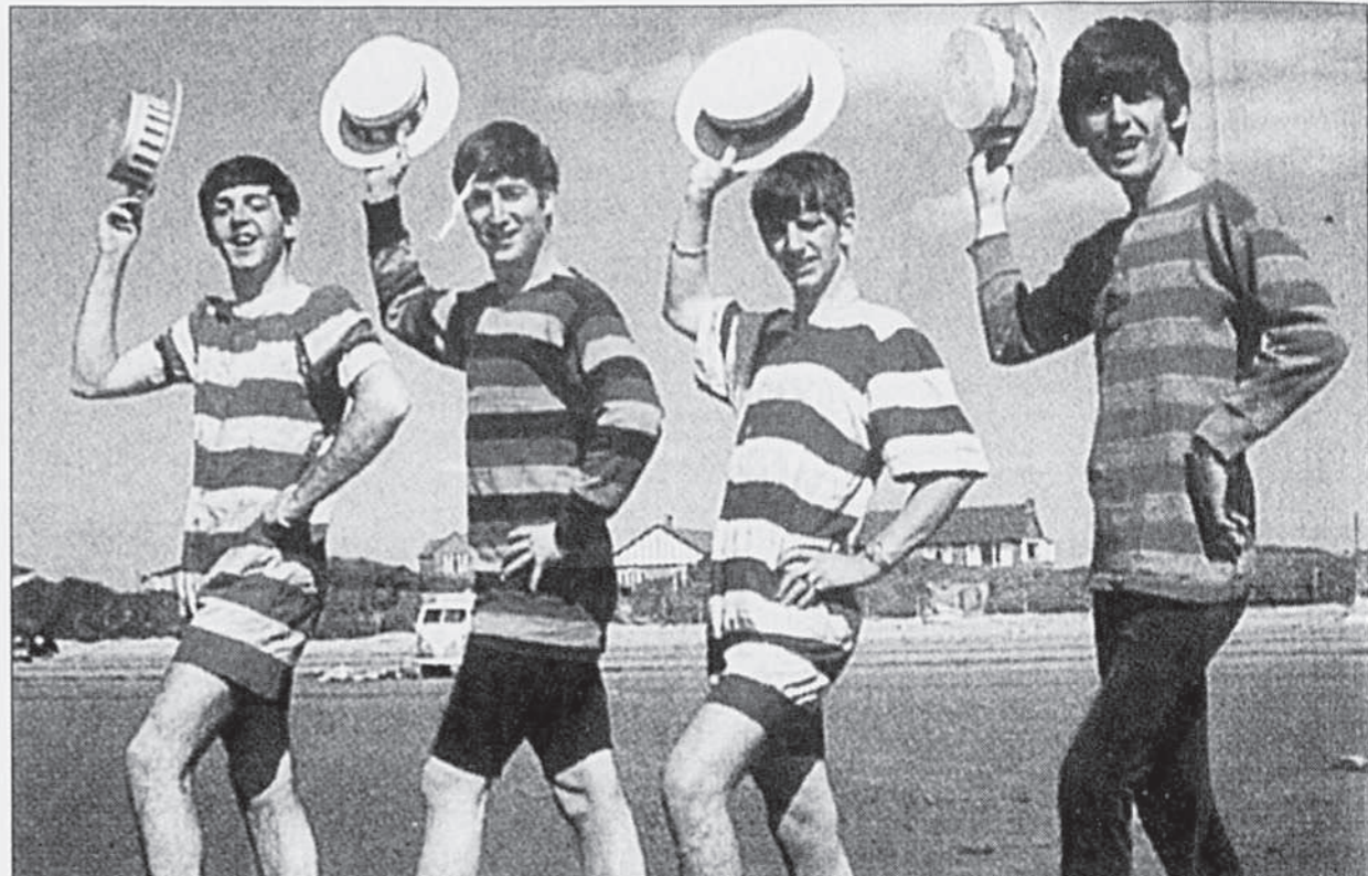
1962-1966 1967-1970 The Beatles Apple (EMI)

Taxman et You're Gonna Lose That Girl? Comment osait-on résumer l'œuvre des Beatles?