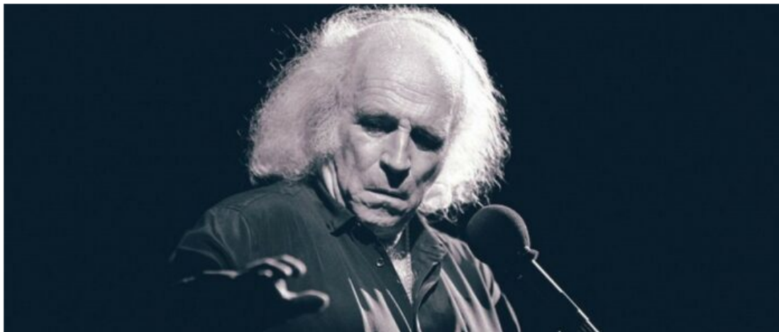
Léo Ferré lors d'un concert à l'Olympia à Paris le 2 octobre 1984

Musique. Après "La Vie moderne, 1944-1959", "L'Âge d'or, 1960-1967", "La Solitude, 1968-1974" paraît « La Marge 1975-1991 », le 4 e volume de l'Intégrale de Léo Ferré . Un beau coffret de 20 CD qui témoigne de la richesse de l'œuvre unique du chanteur-poète anarchiste et chef d'orchestre qui a bousculé les codes en transcendant le format traditionnel de la chanson française.