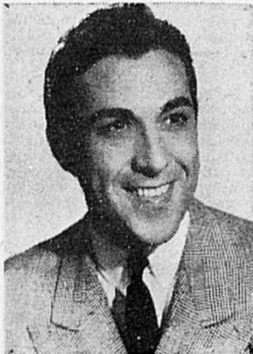
Luis Mariano ... bientôt "A la romance" ?