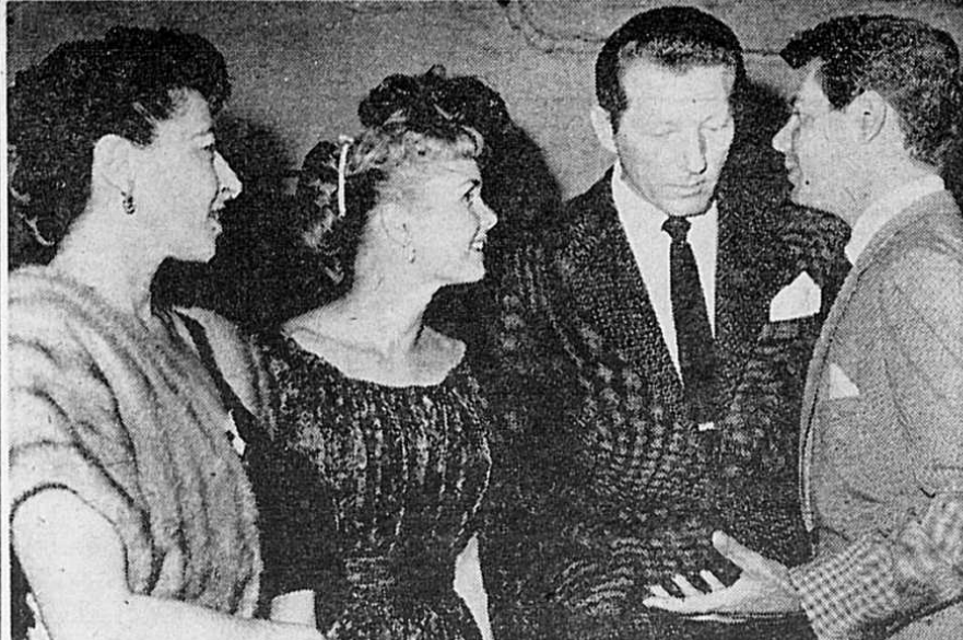
Toujours populaire. — Eddie Fisher fait salle comble dans une boîte de nuit de Las Vegas où il ne devait rester que quatre semaines. Devant tant de succès, on lui a demandé de rester trois semaines encore. On le voit ici avec sa femme et les Danny Kaye, à qui il raconte une histoire dans les coulisses.