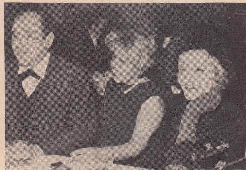
Léo Ferré est venu fêter au Club de l'Etoile la première de son récital en compagnie de Marlène Dietrich.