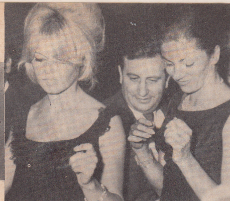
Brigitte Bardot fut une des élèves les plus assidues pour apprendre à danser tant le madison que le loco-motion, la bossa-nova ou le tamouré.