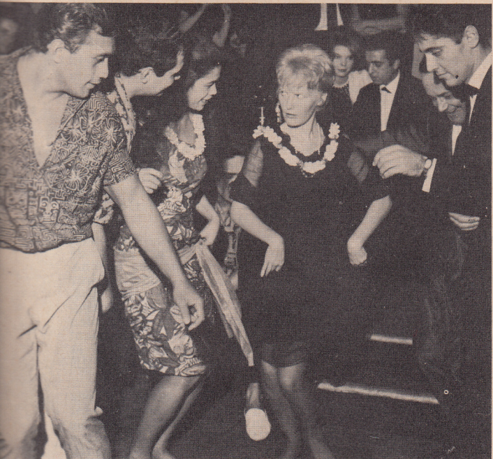
Mais on n'en danse pas moins le Tamouré, comme le montre cette photo où Pétula Clark et Sacha Distel prennent des leçons de Kaveka.