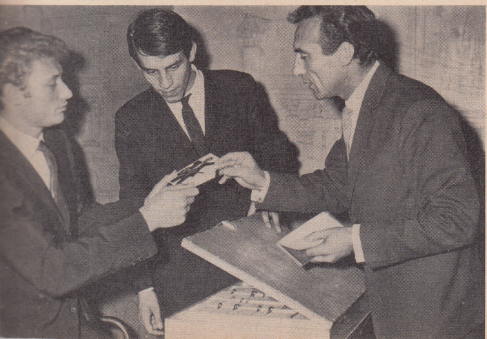
Un des clients assidus du Club de l'Etoile est Johnny Hallyday... au point de se mettre lui-même parfois au contrôle des cartes...