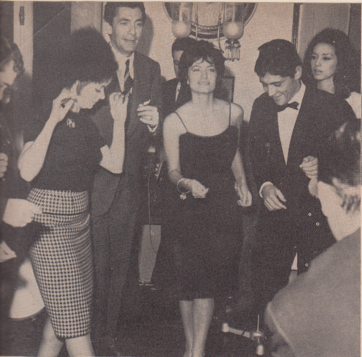
Une des soirées les plus réussies de ce début de saison fut incontestablement la soirée de la Bossa Nova organisée par La Discographie Française et qui réunissait tous les noms de la profession et des dizaines de vedettes.