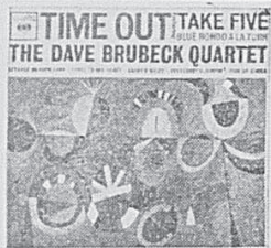
Mono: CL-1397 Stéréo: CS-8192 DAVE BRUBECK Take Five — Three To Get Ready — Blue Rondo à la Turk.