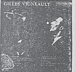
Mono: FL-292 Stéréo: FS-538 GILLES VIGNEAULT Jack Monnoy — Caillou la pierre — Jean-du-sud — La danse à St-Dion — etc.