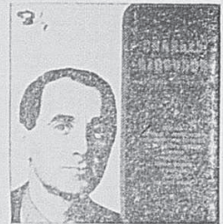
Mono: CBLP-2014 Stéréo: CS-8698 CHARLES AZNAVOUR Allez les enfants — Les Comédiens — Espérance — Tu n'es plus — Les petits matins — Trouve chemise.