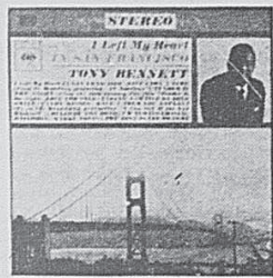
Mono: CL-1869 Stéréo: CS-8669 TONY BENNETT I Left My Heart in San Francisco — Smile — Love For Sale — Laura.