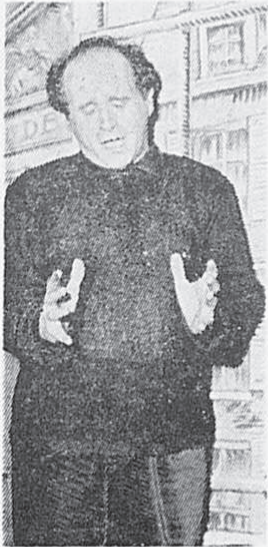
Léo Ferré ... le talent du siècle

Léo Ferré, que les critiques les plus sévères ont consacré "le talent de notre siècle", sera à la Comédie-Canadienne, du 21 au 30 novembre. Il ne faut certes pas manquer ce récital qui nous promet de vraies belles heures. Qu'est-ce qu'un récital pour Léo Ferré ? Il nous le dit lui-même : "C'est un spectacle où une seule personne joue d'un seul instrument. Mon instrument à moi, c'est ma voix; il faut que je chante, comme je suis, bien ou mal." Léo Ferré, l'homme qui dans une simple chanson nous amène à nous découvrir nous-mêmes, a aussi écrit, un peu plus tard : "Je fais un récital pour que Ronsard, Baudelaire, Apollinaire et Aragon aient leur place dans la mécanique contemporaine du juke-box, de la radio, de la télévision." Ce sera la première visite de Ferré à Montréal.