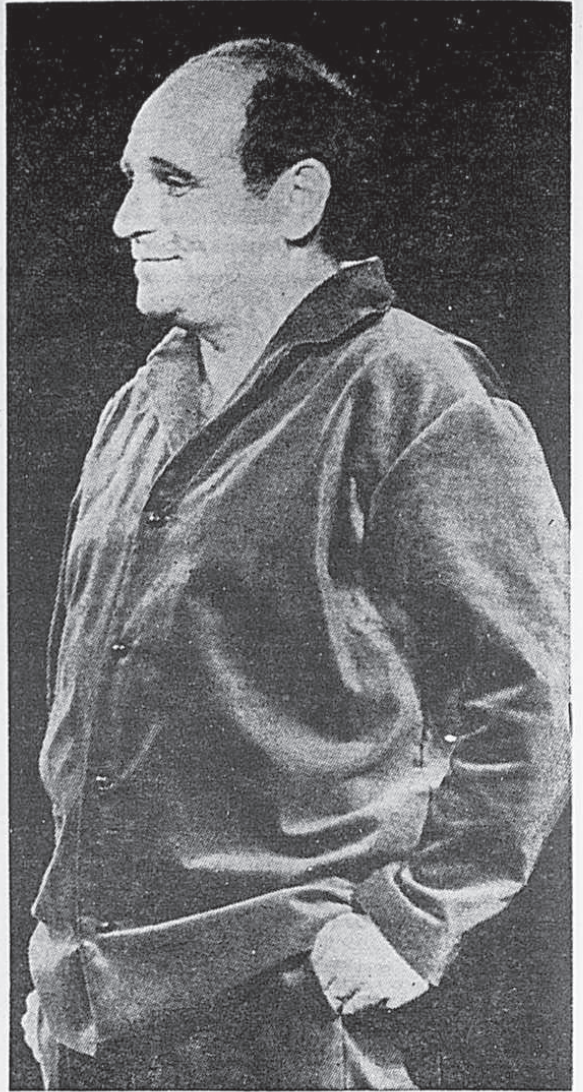
Léo Ferré sera à Montréal, pour la première fois, du 21 au 30 novembre. Il a beaucoup de choses à dire dans ses chansons ! Ses chansons lui ressemblent.