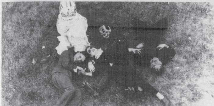
DES MONSTRES LOCAUX qui ont "échoué" sur le Broadway.

CBFT et CFTM présentent hebdomadairement soixante douze (72) heures de longs métrages. Cette forte consommation doit correspondre aux goûts des téléspectateurs puisque les longs métrages se classent parmi les émissions les plus suivies. Nous pouvons voir des westerns le samedi, des comédies musicales le dimanche, des policiers le mercredi et jeudi, le ciné-club le mardi . . . mais dommage que régulièrement les responsables n'inscrivent pas à l'horaire des films d'horreur.