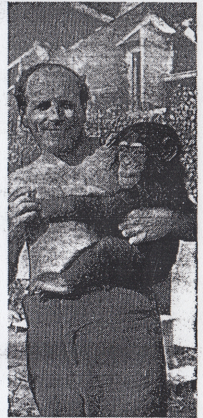
Même lorsqu'il préparait un tour de chant, le seul véritable souci de Léo FERRE demeurait « Pépée », son fidèle chimpanzé.

On se demande si ce Gavroche au vitriol voudra revoir sa fidèle compagne, cette femme dont le regard est plus que jamais clair et