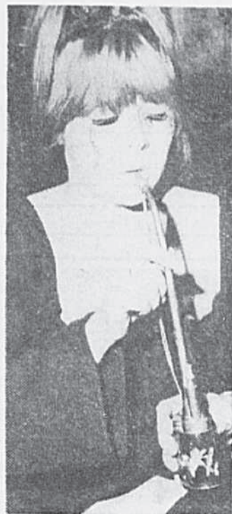
L'Amérique est-elle intoxiquée par des drogues en provenance des communistes ?

tuer pour redevenir lui-même. On le croit.