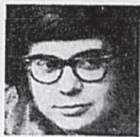
par Roch Poisson