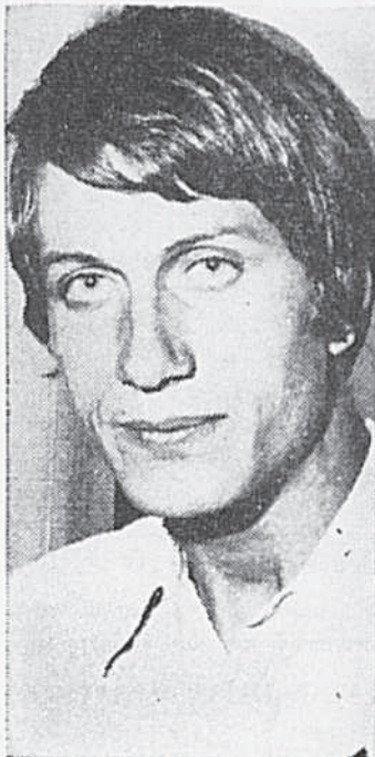
JACQUES DUTRONC ... il aime le canular