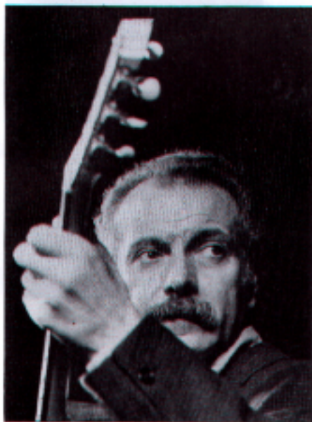
« Georges Brassens »