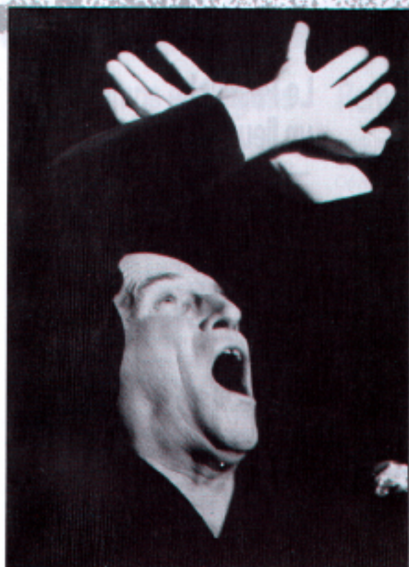
« La Chanson d'Olympia »