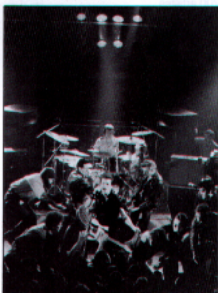
« Les Lumières du Rock »

Pour sa neuvième « saison », Bourges a son Printemps. Pour la première fois, le Printemps propose cinq expositions en symbiose parfaite avec l'esprit et le caractère unique de ce festival populaire. Unique aussi est l'artiste choisi pour refléter l'âme même de ce fascinant « meeting pot » du spectacle : Jean-Pierre Leloir, photographe.