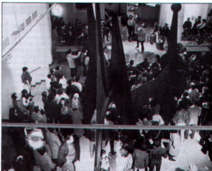
« Printemps de Bourges 1984 »