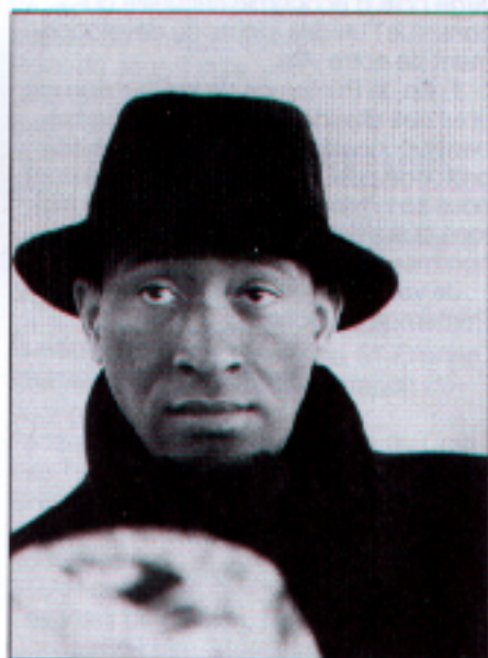
« Du Jazz plein les yeux »