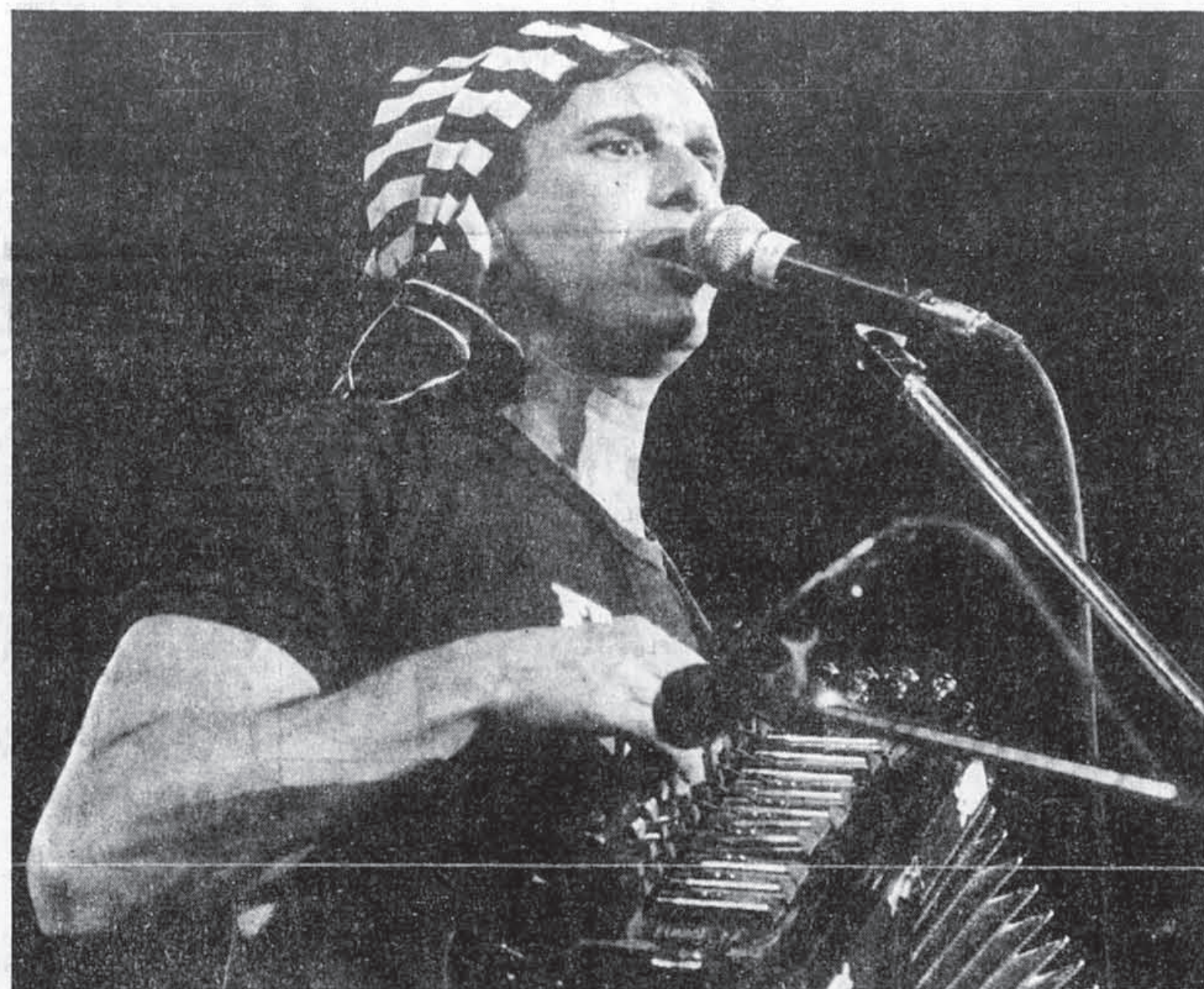
Sur la scène du Pigeonnier, à l'ouverture du Festival d'été de Québec.