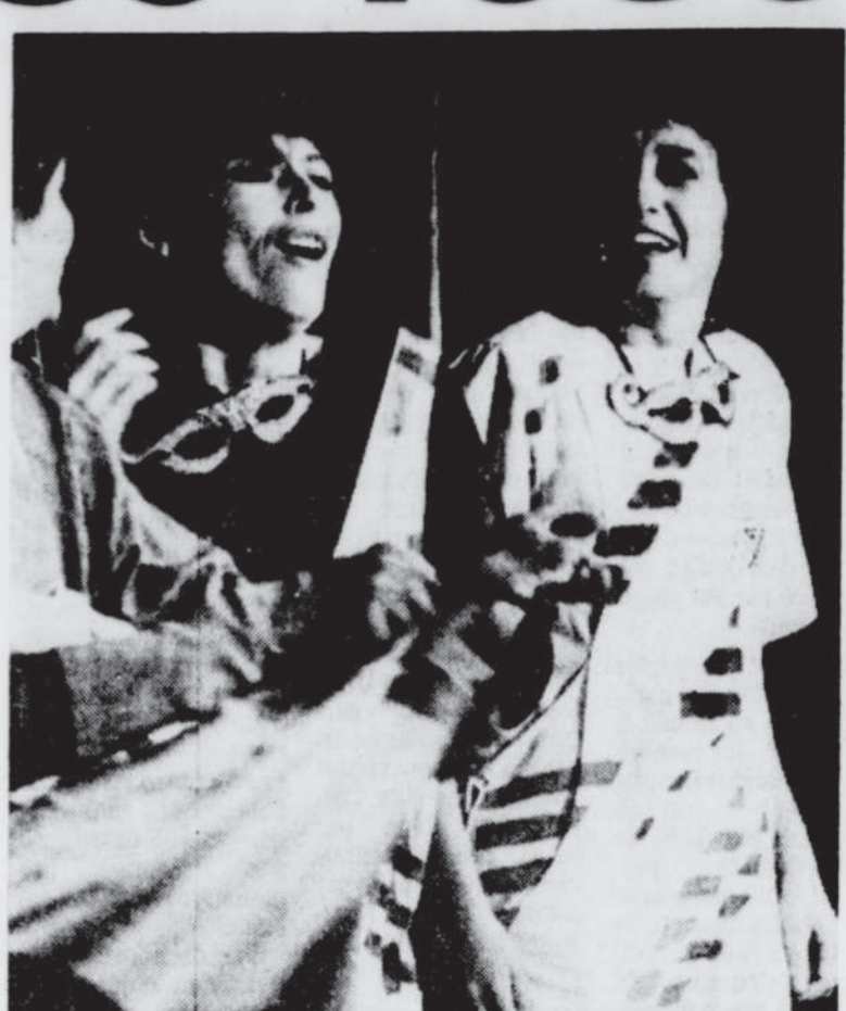
Les Folles Alliées seront de retour en octobre avec "Mademoiselle Autobody", à La Bordée.